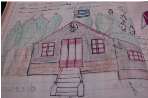
Escuela Cuaderno de Antonia Gallardo, alumna de Jesualdo (Diez, 2012)

En el año 1928 pidió traslado a la Escuela Rural N° 56 de Canteras del Riachuelo, departamento de Colonia, Uruguay. En dicho pueblo permaneció aproximadamente siete años desarrollando su principal experiencia educativa, embarcada en un lugar pobre, “poblado por inmigrantes donde se conjugan las más variadas nacionalidades y donde el trabajo era de riguroso esfuerzo” (Azar, 2005: 12).