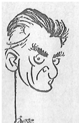
Caricatura del año 1962

Jesús Aldo Sosa, conocido durante toda su vida como Jesualdo fue un maestro nacido en Tacuarembó, República Oriental del Uruguay. En 1910 su familia se traslada a Rivera, estableciéndose en el pueblo de Tranqueras donde cursa su primaria.